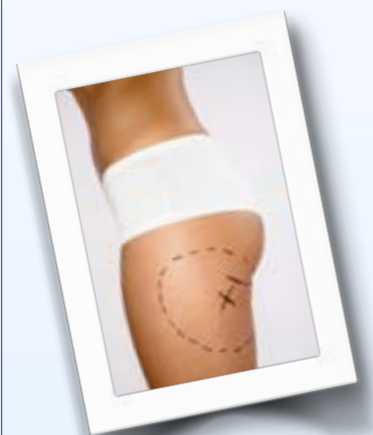
settoriali rappresenta una delle ultime novità in materia di medicina e chirurgia estetica.