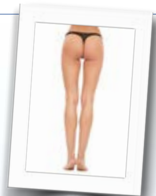
L'utilizzo delle soluzioni iniettabili lipolitiche per il trattamento delle adiposità

La soluzione Motolese a differenza della fosfatidilcolina e' stabile a temperatura ambiente e maggiormente attiva di questa. La forma iniettabile è presente nel farmaco Aqualyx . I preparati iniettabili da utilizzare nell'intralipoterapia sono prodotti in forma galenica da alcune aziende farmaceutiche e sono studiati e messi in commercio per questo preciso scopo.